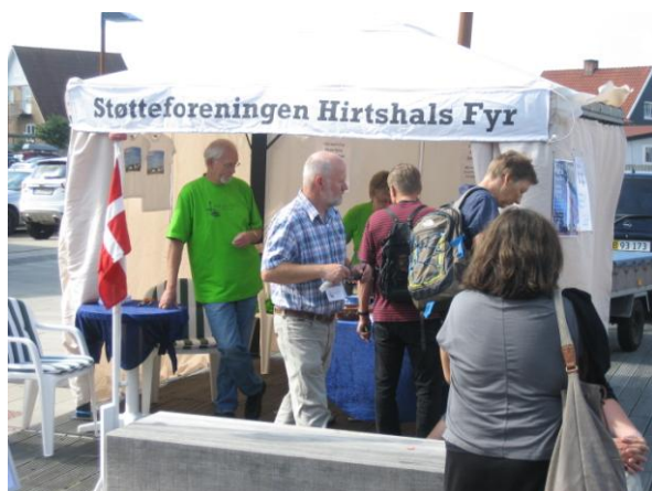
Stemningsbillede fra dette års Fiskefestival.