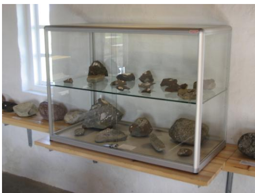
En af de nye glasmontrer, finansieret med støtte fra Friluftsrådet