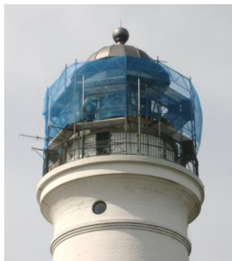
Fyrets top i forklædning

Fyrtårnet har i siden den 20. august 2012 fået sit lanternehus kigget efter i alle sine sprosser. Derfor har der i perioden været lukket for adgang til tårnet. Kaffestuen har dog i perioden frem til 2. september haft åbent, og har derved kunnet byde på kaffe og fyrkage til de mange, der var kørt forgæves for at komme op i selve tårnet. Reparationsarbejdet er udført af lokale håndværkere, og udgiften er afholdt af Søfartsstyrelsen. Arbejdet forventes afsluttet uge 38 afhængigt af vejret.