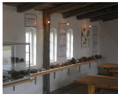
Madpakkerummet med stensamlingen