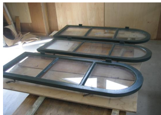
Vindueshullerne afblændet mens..... vinduesrammerne ligger nymalet klar til isætning