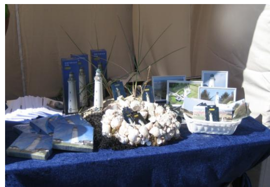
Et lille udpluk af de mange ting der sælges i Fyrets kiosk.

Udvalget for kaffestuen / kiosk samt Udvalget for billetsalg har sommeren igennem taget godt i mod vores mange gæster. Åbningstiden i kaffestuen har i år været fra 16. juni til og med 2. september. Den danske sommer har desværre nok betydet en lidt mindre indtægt i forhold til tidligere år – specielt på issalget. Resten af året passes billetsalget af "selvbetjeningskassen" i Tårnet.