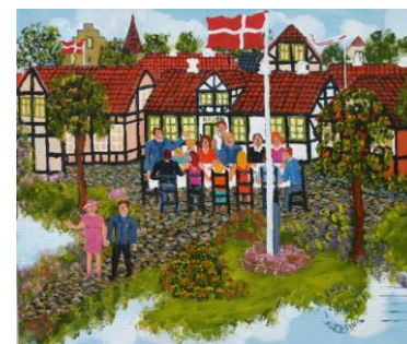
"Gadefest" - Snekke Kristensen

Fernisering lørdag den 13. oktober kl. 13.00 Udstillingen løber til og med 21. oktober - hver dag fra kl. 13.00 - 17.00 Udstiller: Snekke Kristensen, separatudstilling.